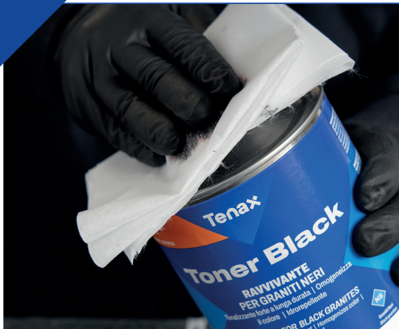
Слегка смочите ткань